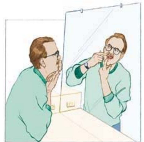
Imagen de una persona revisando para ver si tiene fuegos en la boca por su tratamiento de quimioterapia.

Si su boca es sensible o si nota que se están formando fuegos, hable con su doctor. Su doctor podría darle medicina para proteger el interior de su boca y reducir el dolor que los fuegos le causen.